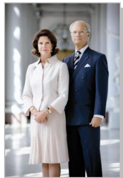
H.M. Konung Carl XVI Gustaf, Vår Ordens högste beskyddare, och H.M. Drottning Silvia

En svensk-amerikansk vänskaps- och kulturorganisation med verksamhet i USA, Kanada och Sverige. En organisation vars syfte är att värna om svensk kultur och svenska traditioner, och att verka för att skapa och upprätthålla vänskapliga förbindelser mellan svenskar och svenskättlingar i USA och Kanada. Vasa Orden av Amerika är en opolitisk och religiöst obunden organisation.