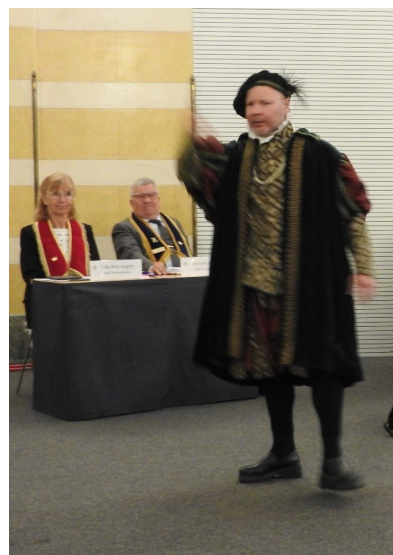
Hertig Magnus av Östergötland