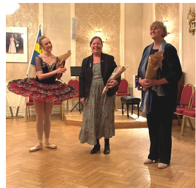
Kvällens underhållare tackades med en blomma