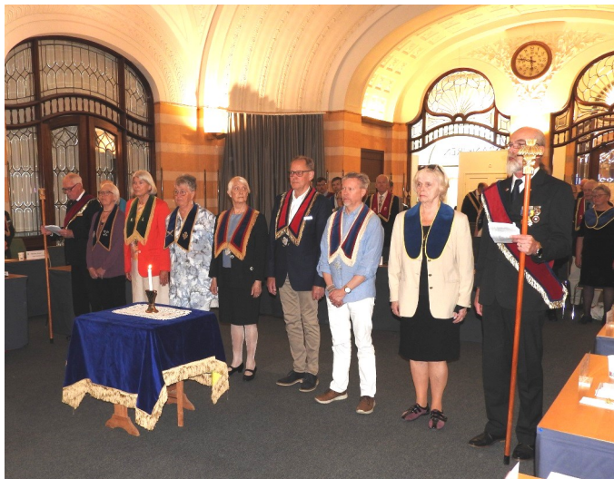
Våra nya distrikts delegater