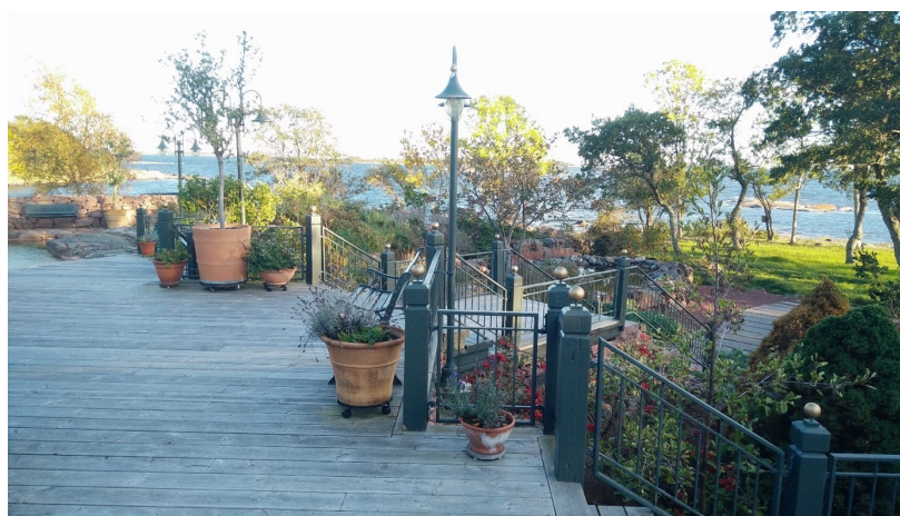
Utsikt från "sommarstugans" terrass mot öster...

Vi fick löfte om att få den också, när nya upplagan kommer.