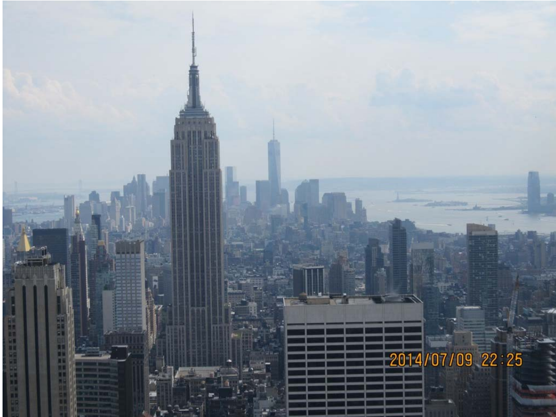
Utsikt söder ut från Top of the Rock från Rockefeller Center.