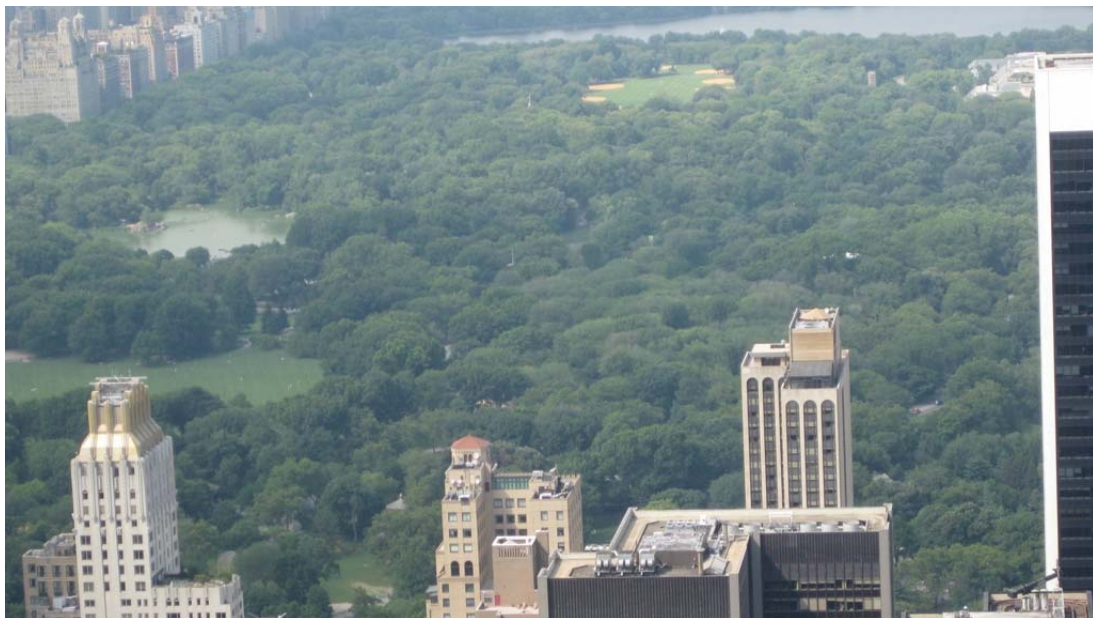
Utsikt norr ut över Central Park från Top of the Rock från Rockefeller Center.