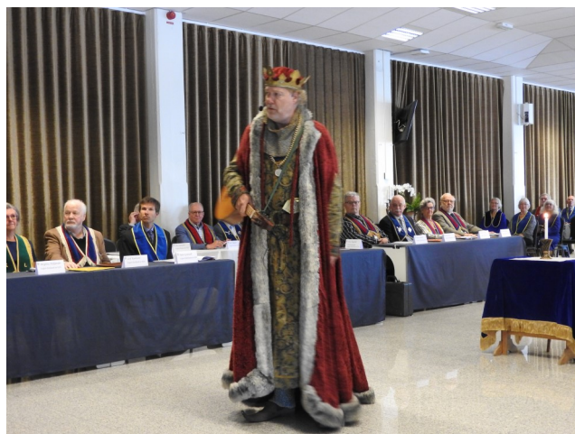
Distriktsmötet fick celebrert besök av Kung Birger, som berättade om Nyköpings historia för intresserade mötesdelegater.