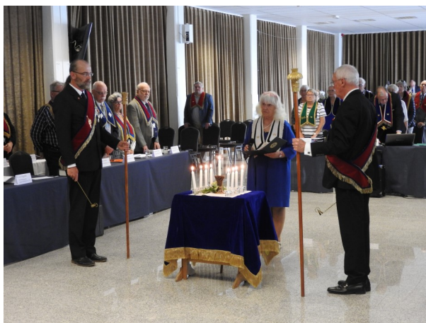
Parentation hölls för under året bortgångna Distriktsmedlemmar.