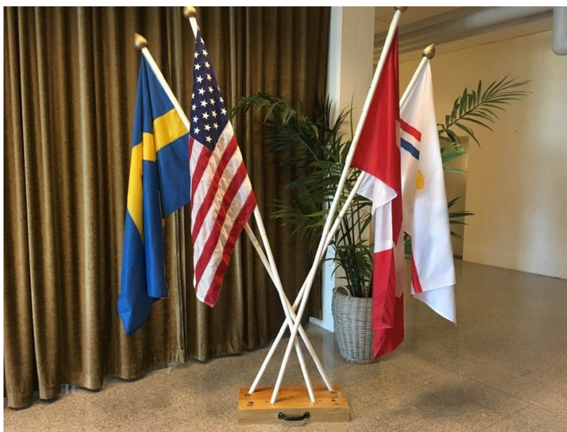
Våra fanor utanför konferenslokalen.