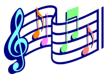
Kvartetten Bubbeklubben underhöll oss med många vackra sånger - både med svensk och amerikansk anknytning.