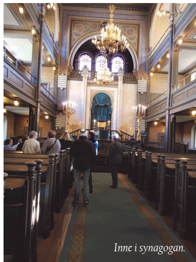
Inne i synagogan.

Synagogan är byggd år 1855 och ligger i anslutning till församlingshuset. Den rymmer 300 sittande och har en Marcussenorgel som används vid konserter.