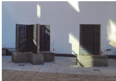
Minnesdokumentet i form av bok.

Minnesmonumentet som är i form av en öppen bok har namn på de judiska medlemmarna som kom med de Vita bussarna, samt deras närmaste anhöriga.