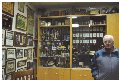
Del av arkivet förevisat av Bob Andersson

The Viking Hall består av en stor samlingslokal med kök för logemöten som även kan hyras av allmänheten för stora möten, bröllop m m. Här finns också arkivet för New Jersey District Lodge No 6 (se bild nedan).