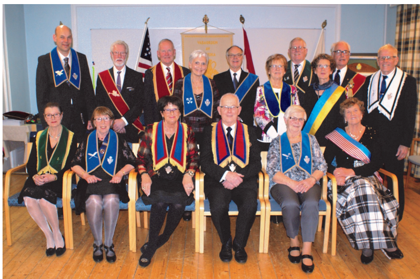
Logen Kongahällas nya tjänstemän