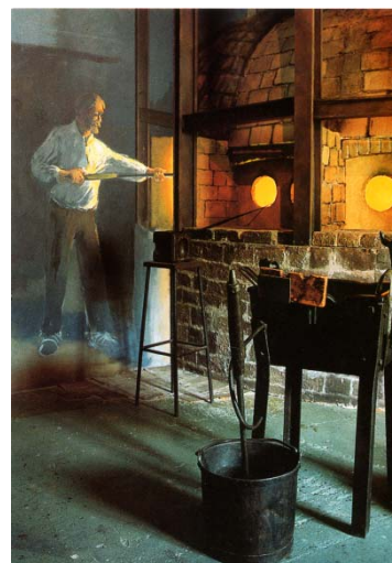
Surte Glasbruk som idag är ett museum