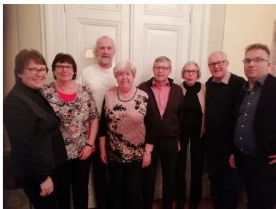
Deltagare från Logen Bräviken nr 751.