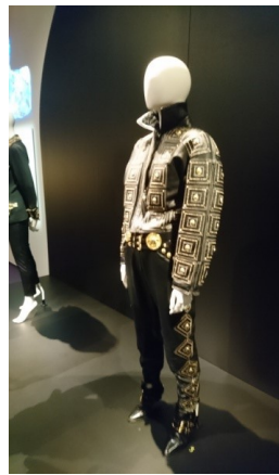
I bildcollaget visas exempel på utställningsdockor iklädda skapelser av Gianni Versace.

Där syns också några av deltagande Vasa-syskon vid den avslutande lunchen.