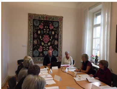
Deltagare i Ordförandekursen.

Då jag är Vice ordförande, och en nyligen installerad sådan, var det mycket bra för mig att få deltaga i denna kurs.