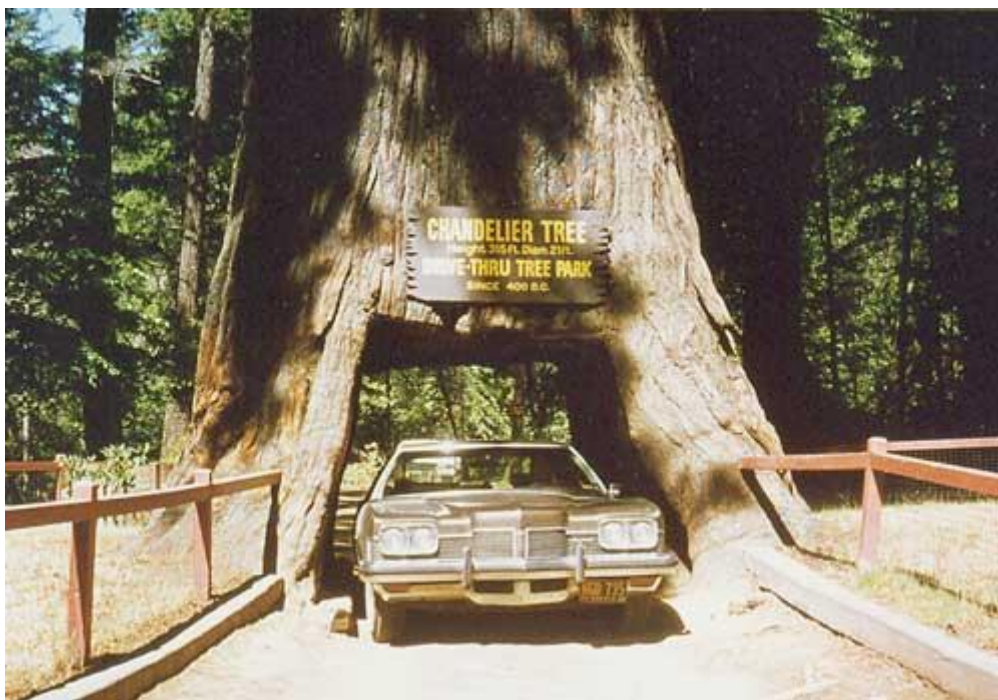
(Bild: I Redwoodskogen, Kalifornien 1974. Den "lilla" bilen genom det stora trädet.)

Väl nere i området San Diego/La Mesa i södra Kalifornien mötte oss ett digert program med bl. a. midsommarfirande i Balboa Park, för övrigt det mest "svenska" midsommarfirande vi någonsin upplevt. Det var så "svenskt" att vi till och med kände doften av skånsk akvavit, då en liten medförd 37:a läckt i vår resväska mitt bland inlånade hembygdsdräkter. Vi räddades av en vänlig Vasasyster och hennes tvättmaskin. Men vi själva – förhoppningsvis bara vi – tyckte oss känna den kanske speciellt svenska midsommardoften i Balboa Park.