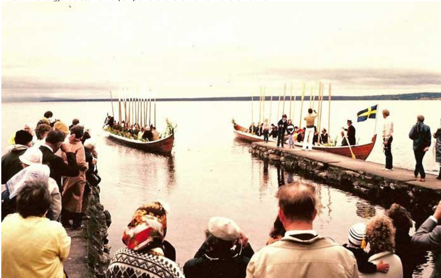
(Bilden: Sverige-resan. Kyrkbåtarna anländer över Siljan till Rättvik i midsommartid.)

Rättvik och Leksand präglades också av att det var midsommartid med kyrkbåtar och annat. Alltsammans gjorde starkt intryck på våra svensk-amerikanska vänner.