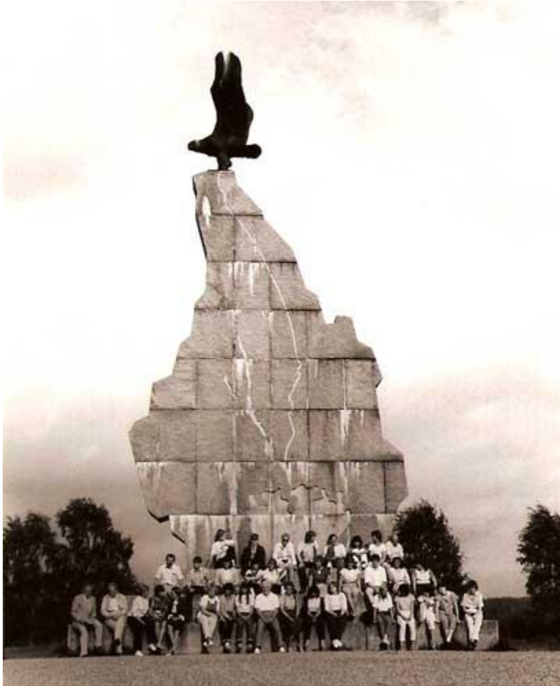
(Bilden: Karlskrona-kursen 1984. Deltagarna samlade framför Samfrände monumentet i Rottneros.)