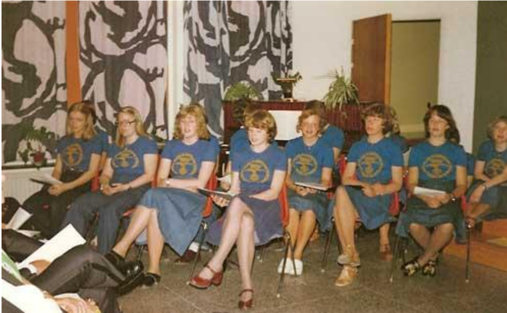
(Bildens: Ungdomsklubbens sångare blev mycket uppskattade.)