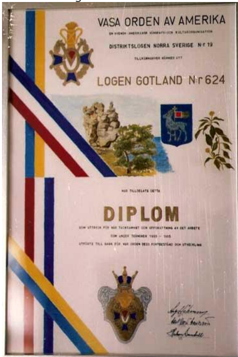
(Bildens: Medlemsvärkning i DL 19 1983-1985. Logen Gotland nr 624 tog hem priset.)

rekordfisken – som aldrig tycks dyka upp- finns kvar. Höjden av lycka är också att en varm sommarkväll i en stilla havsvik sitta och "pilla vitling". Eller uppleva ett makalöst makrillfiske ! Men intresset för arbete i distriktslogen hade inte falnat eller försvunnit under dessa år. Det fanns i hög grad kvar och när DL 19 Distriktsmöte närmade sig gav jag vika och ställde upp på nytt som kandidat, då nomineringskommittén hörde av sig. Denna gång gällde det uppdraget som VDM. Jag blev också vald till detta vid Distriktsmötet i Karlstad 1983. Uppdraget innebar bl..a. att medlemsfrågorna inom DL 19 kom att ligga på mitt bord.