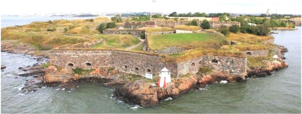
Sveaborg Lodge´ vinjettbild – Sveaborg vid inloppet av Helsingfors