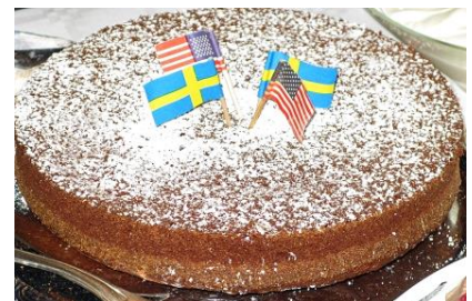
Den oförglömliga Tårtan