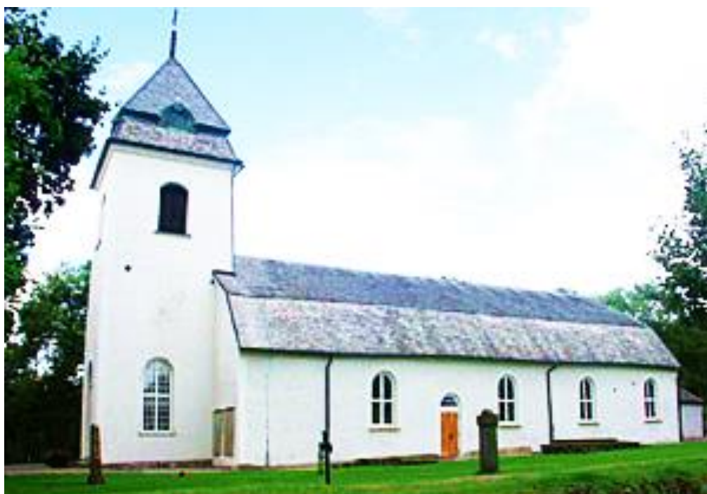
Västra Tunhems kyrka.