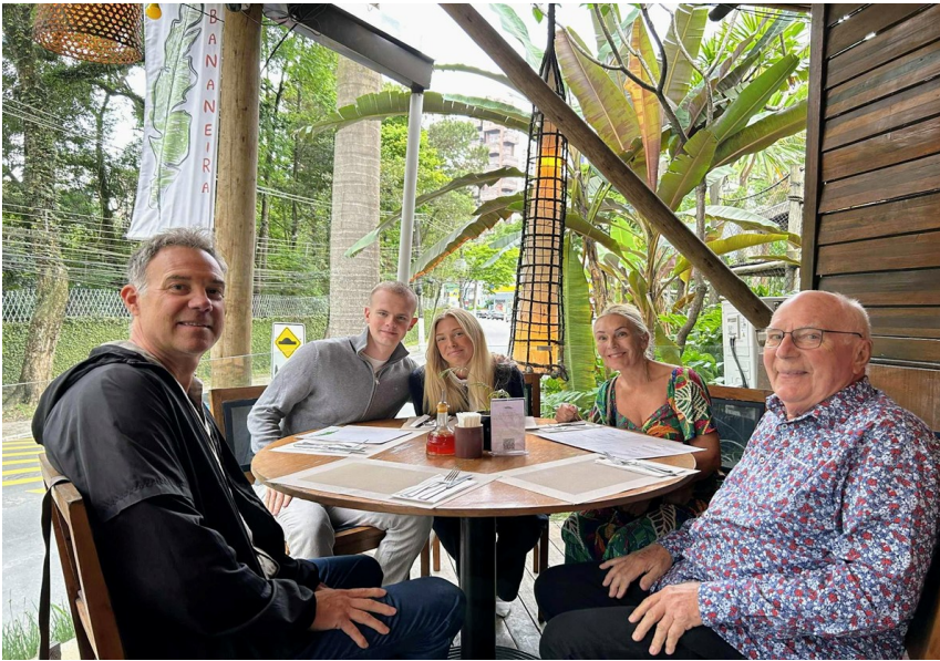
I väntan på den goda kycklinggrytan med fisk, mango och grönsaker