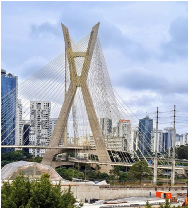
Oliveira-bron invigdes 2008. Världens enda snedkabelbro med två böjda körfält burna av en mast.