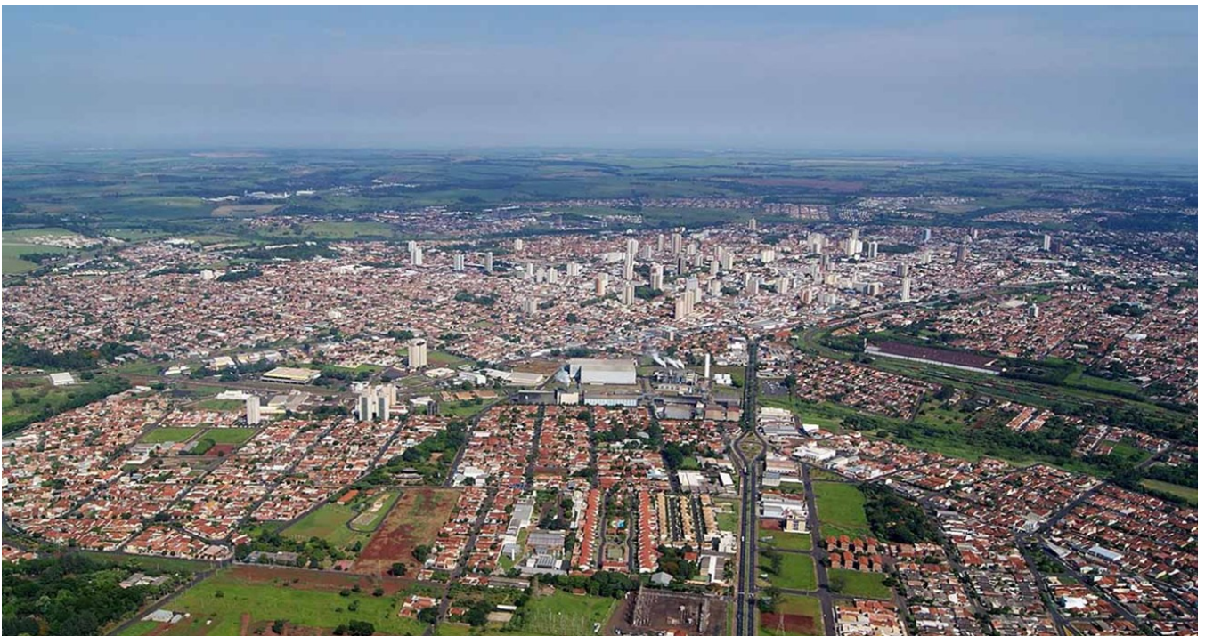
Staden Araraquara ligger 3,5 timmars bilresa från São Paulo. En stad med ca 200 000 invånare.