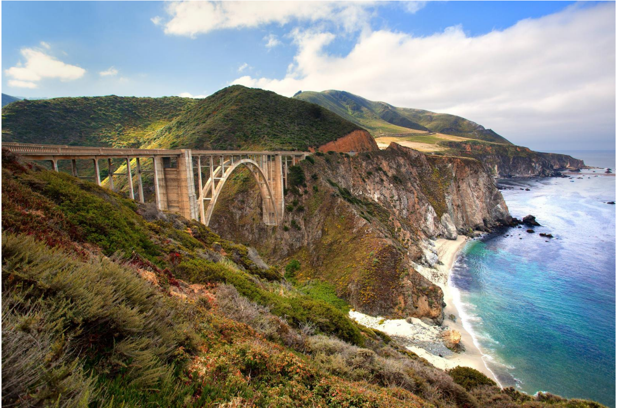
California State Highway 1, strax söder om Carmel