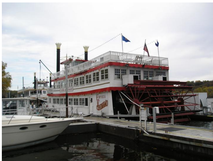
Flodångare på St Croix-floden i Stillwater

en centralort för utskeppning av timmer och säd. Floden är farbar ända upp till vattenfallen vid Tailors Falls i höjd med Lindstrom.