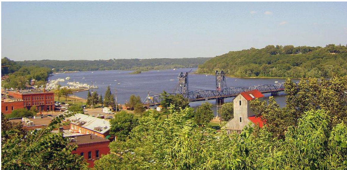
Stillwater, MN. En höj-och-sänkbar bro (Lift bridge) förbinder Minnesota till vänster med Wisconsin till höger