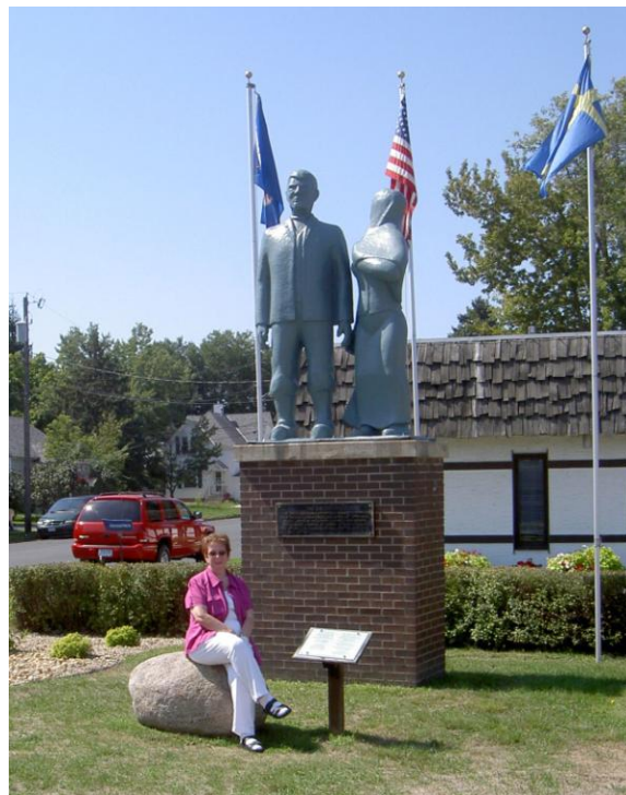
Karl-Oskar och Kristina –invandrarstaty i Lindstrom