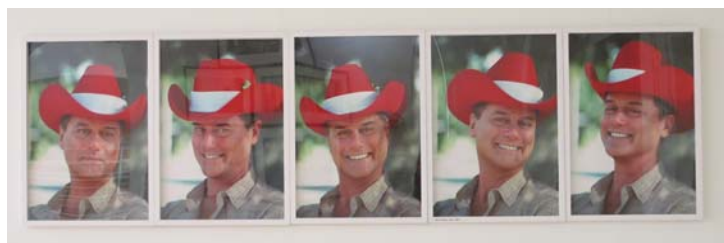
Skådespelaren Larry Hagman alias J.R Ewing fanns med - SMILE