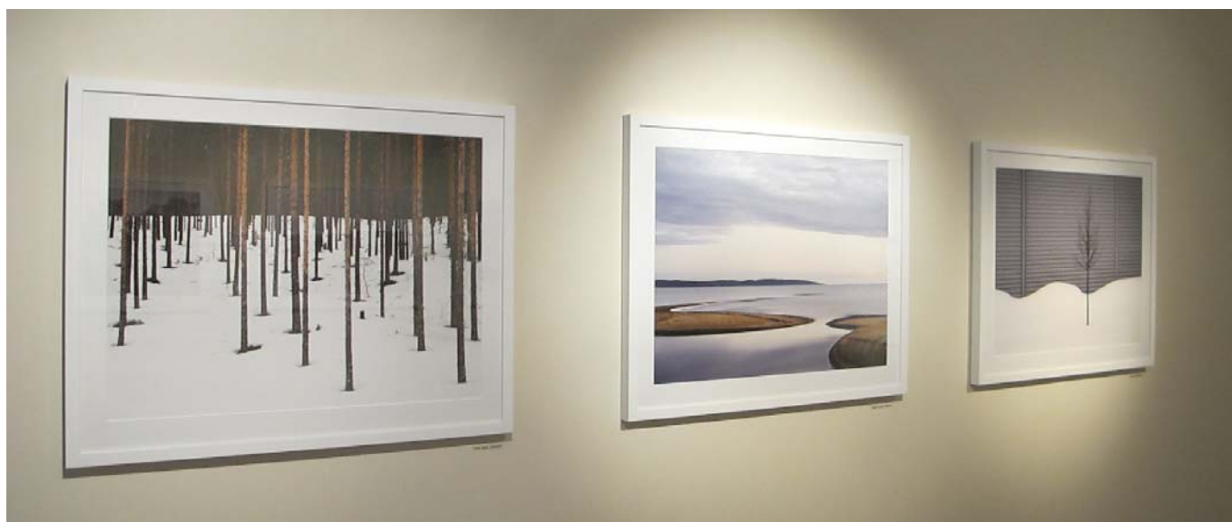
Tre av Jan Töves landskapsbilder