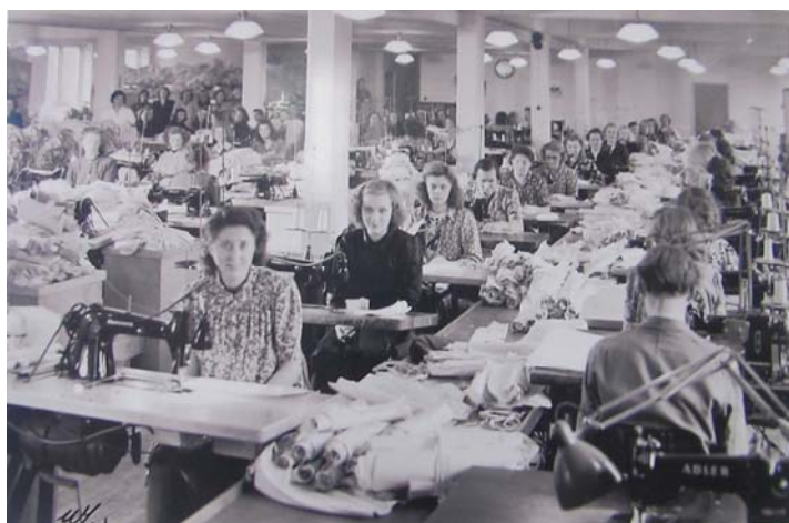
Ett foto som visar flitiga kvinnor i korsettfabriken Abecita