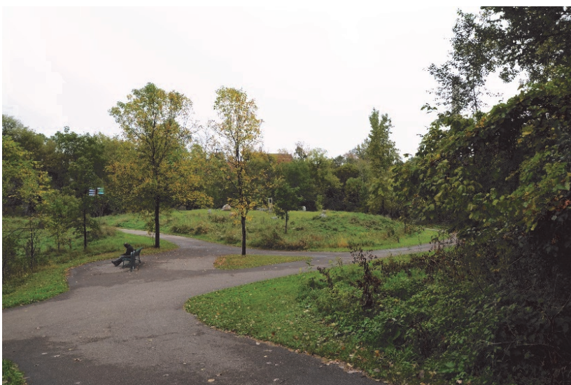
Minnesplatsen i parken och i bakgrunden, på vänster sida av dalen, syns hus uppe på Drewry Lane.