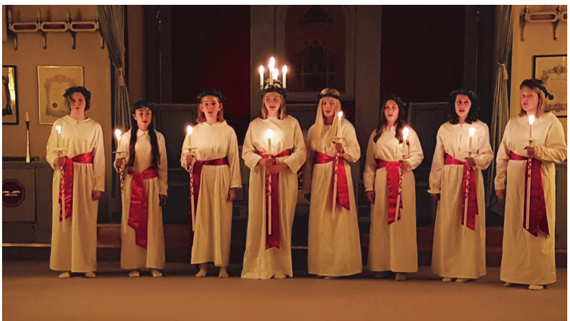
Luciatåget i Logen Lidköping