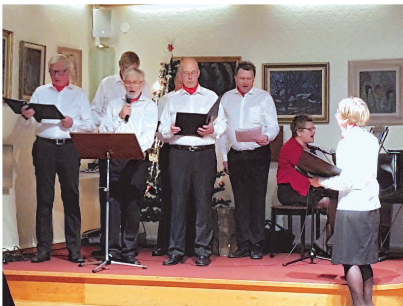
Herrarna i Knallekören framför sina sånger.

Logens sista sammankomst 2017 ägde rum Nobeldagen den 10 december. Ett sextiotal logemedlemmar och gäster samla-