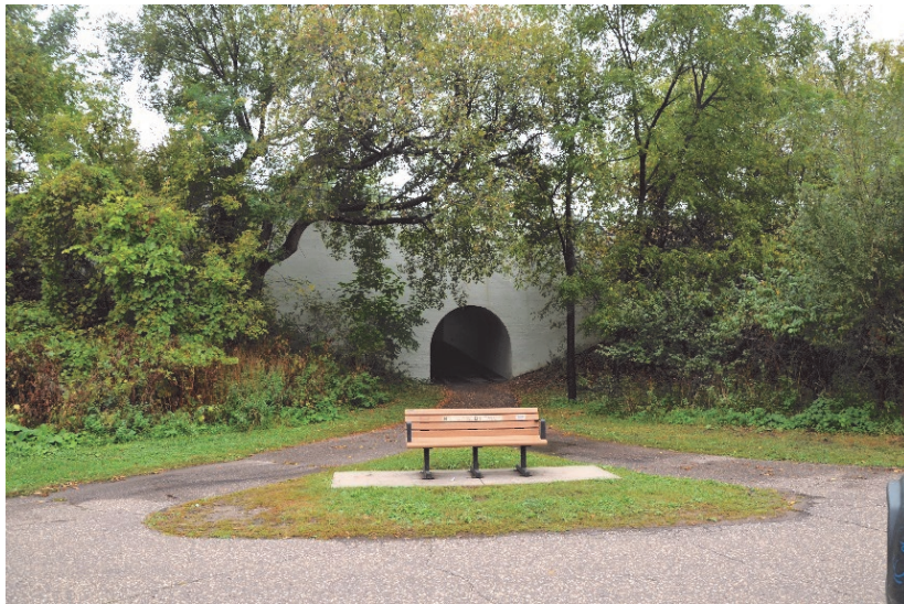
Tunneln som leder upp till Drewry Lane.