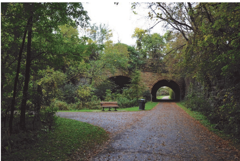
Promenadvägen där järnvägen gick och vi tog av till vänster innan vi kom till bron East 7th Street.

Så kom Ola Larssons bok ut och den läste jag parallellt med den lilla skriften. Skriften har bilder och en ritad karta på hur Swede Hollow såg ut från den tiden Ola skriver om. Jag blev fascinerad av de personer och öden som boken handlar om och när jag åter kom till St. Paul i höstas så var parken ett givet besök. Med på resan