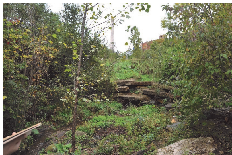
Del av bäcken Phalen Creek med bryggeriet Theodore Hamm Brewery i bakgrunden.