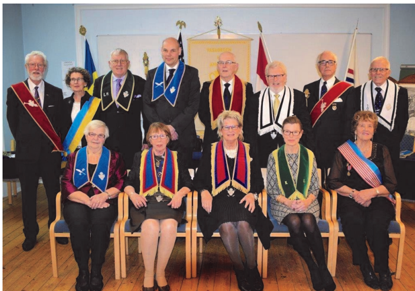
Logens nyvalda tjänstemän

Punkterna Kontakt Amerika och Ordens väl genomför-