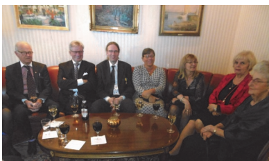
En blandning av båda logernas medlemmar träffades i baren.

Ömsom sol och ömsom regn, som det brukar vara nära Valborg, och vi samlades i Odd Fellow-lokalen för trevligt småprat innan vårens sista logemöte skulle börja.